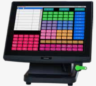
HX-4500 mit Dallas-Aufnehmer (Standard)

Das Kassensystem entspricht den Anforderungen der deutschen Finanzbehörden gemäß des BMF-Schreibens vom 26.11.2010