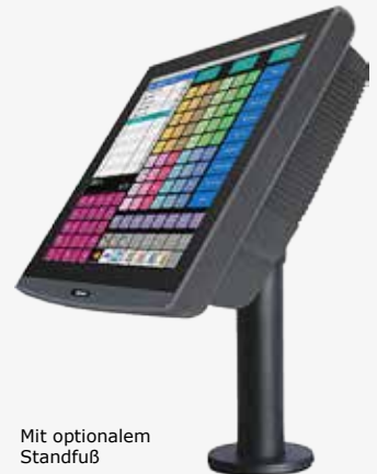
Mit optionalem Standfuß